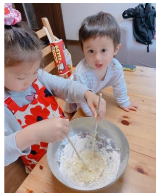
あんこから手作りの あんぱん♪